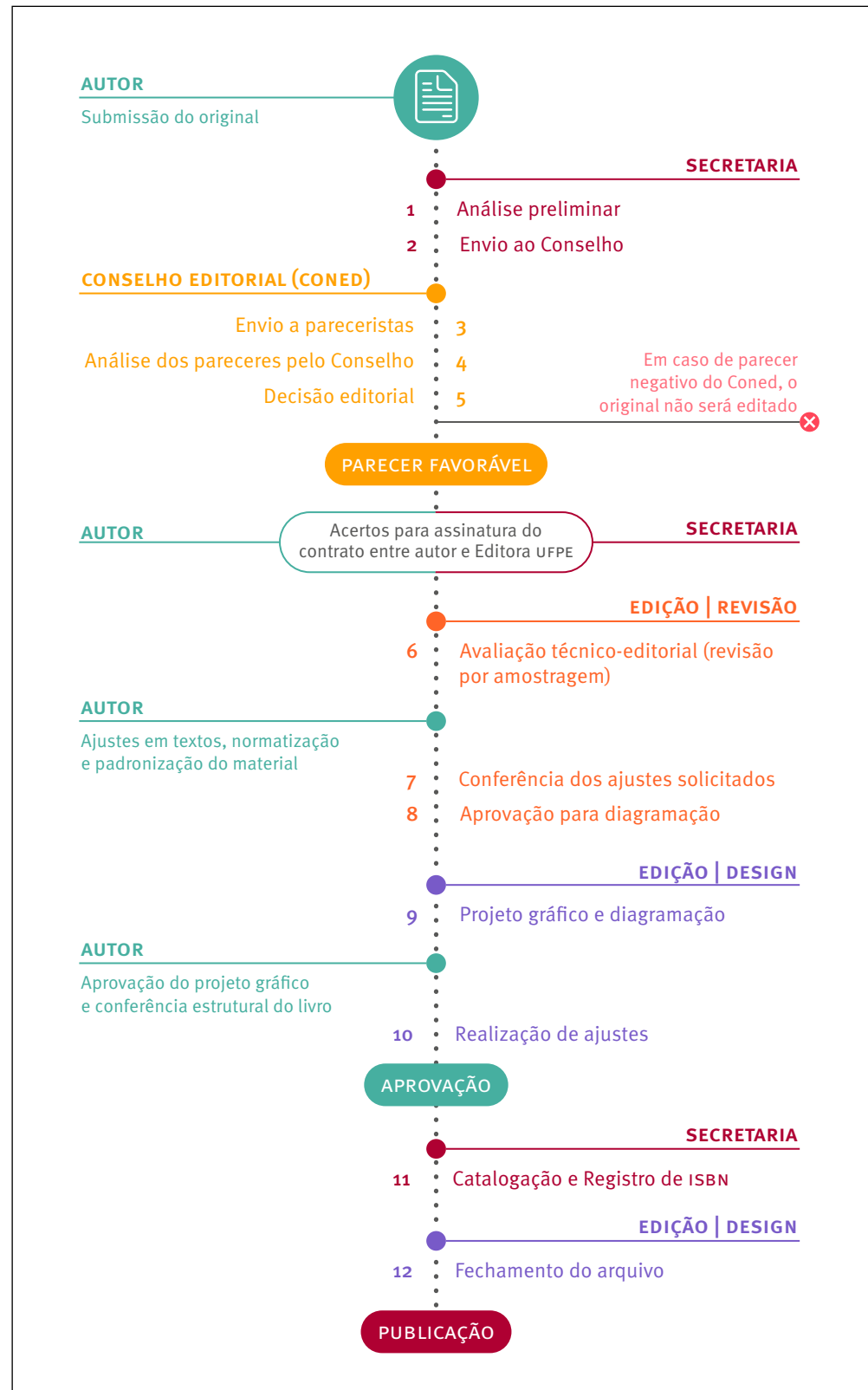
Figura 6. Aqui é possível entender todo o processo do livro e as instâncias responsáveis por cada etapa